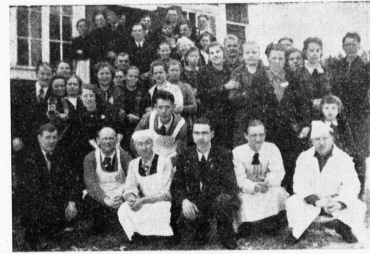
Osanottajia ja »emäntiä» Järvi-Jussilassa.

Ponnet hyväksyttiin ja asia jätettiin keskushallituksen toimeenpantavaksi. Jatkuu.