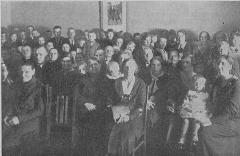
Porin k.m. yhdistyksen loppiaisjuhla omassa talossaan 6/1 -34

Suomen Kuuromykkäinliiton vuosikokous pidetään Helsingin kuuromykkäin yhdistyksen huoneustossa maaliskuun 24 p:nä. Kokous aloitetaan hartaushetkellä kirkossa ja jatkuu kello 1 kokouspaikassa. Kokouksessa käsitellään sääntöjenmukaiset asiat: esitetään vuosikertomus ja tilit, toimitetaan keskushallituksen ja lisätyn keskushallituksen jäsenten vaalit sekä keskustellaan Liiton toimintaa koskevista kysymyksistä. Vuosikokoukseen kehoitetaan haarasastoja lähettämään edustajiansa, joitten rauta-