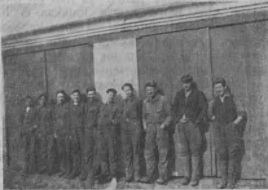
Lepohetki työn lomassa

vastainen järjestelijä. Käydessäni siellä oli koulu vasta alullaan, mutta lähitulevaisuudessa se saa yhä täydellisemmän muodon ja on sitä silloin varmaankin pidettävä hyvänä maanviljelysmallikouluna kuuromykkäin jatko-opetuksessa.