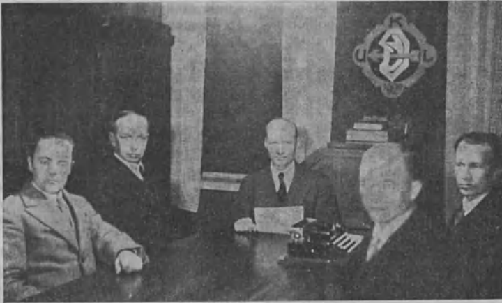
KUL:n hallituksen syyskokous 28. 10. 33.