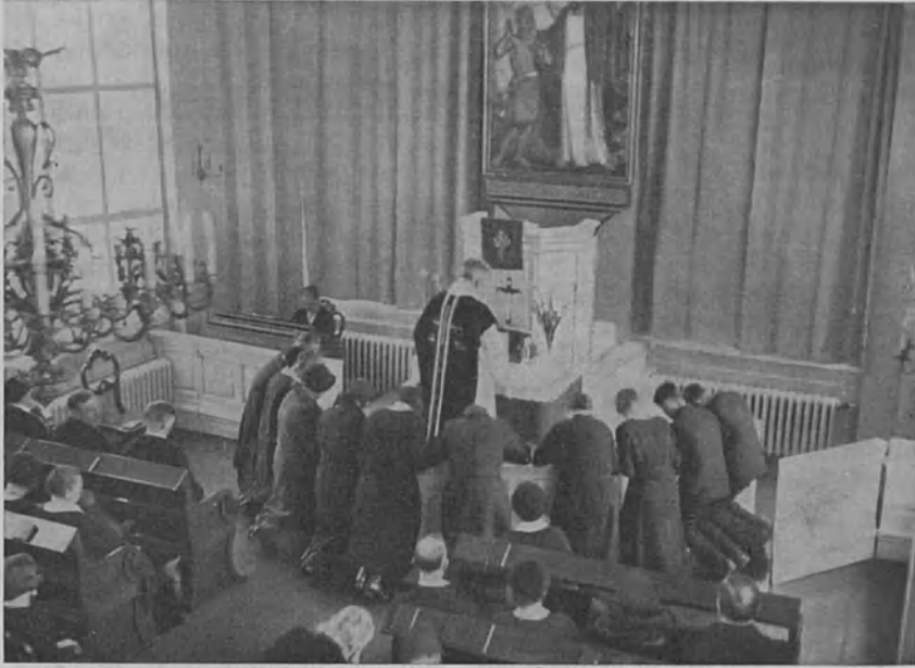
Uusi messupuku ensikerran käytännössä Helsingin kuurojen jumalanpalveluksessa pitkänäperjantaina