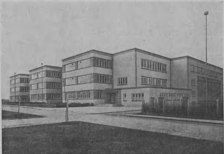
Soestin uudenaikainen kuurojenkoulu Saksassa

Oli tammikuun ensimmäisiä pyhäpäiviä — oliko se uudenvuoden- vai loppiaispäivä — sitä en voi muistaa — kun joku kotolaisistani kirkosta palattuaan ilmoitti meille, kolmelle kuu-