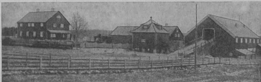
Kuurojenkoti „Sukke“ Norjassa

Laitoksessa oli 18 kuuroa, joista oli 5 tyttöjä ja 13 poikia. Sinne voidaan ottaa 50 kuuroa. Pojat tekevät maanviljelystöitä, toiset heistä työskentelevät puuseppätyöhuoneessa ja sahassa ja talvella metsässä sekä auttamassa johtajaa turkiseläinten hoidossa. Tytöt taas tekevät kotitaloustöitä. Kaikilla on tarkka työjärjestys ja töissä vuorotellaan johtajan ohjeiden mukaan.