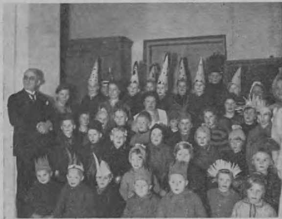
Pikkujoulun vietto Turun kuurojenkoulun asuntolassa.