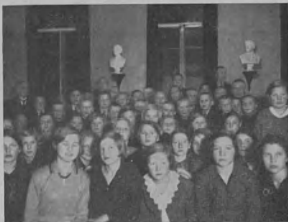
Turun kuurojenkoulun oppilaat pikkujoulua viettämässä.

komean joululakin. Siinä puvussa sopikin hyvin ruveta joulukahvia juomaan. Kylläpä se maistuihin hyvältä pienissä suissa. Pian tulla tepasteli pitkäpartainen joulupukki ja jakoi kullekin pienen lahjan. Myöskin valokuvaaja — opettaja Kosti Lehtinen oli saapunut pienten juhlaan. Vieressä olevassa kuvassa näemme iloiset oppilaat juhlahakeissaan. Välillä esittivät oppilaat leikkejään ja nauttivat karamelleista, joita joulutonttu tarjoili heille. — Lopuksi kiittivät johtaja ja oppilaat asuntolanjohtajarta, kokelaita, hoitajattaria, emännöitsijää ja talousapulaisia asuntolan lapsille toimitetusta ilosta, mikä varmaan monellekin oli ensimmäinen heidän elämässään.