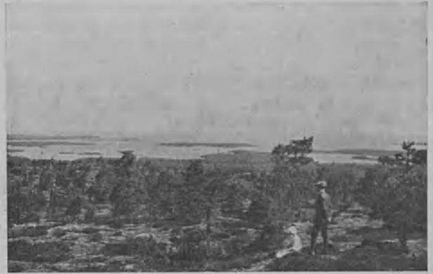
2. Orrnaldsklint Ahvenanmaan korkein vuori Saltvikin pitäjässä