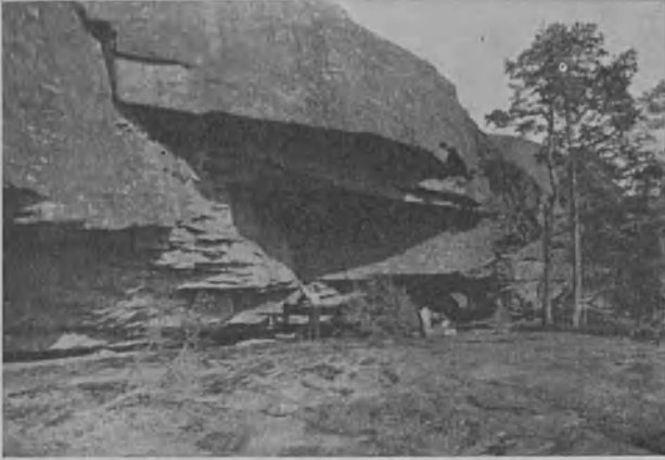
3. Kalliomuodostumia Getan pitäjän vuoristossa

palanen Suomea, isänmaatamme on. Silloin ei kuitenkaan lehteen mahtunut kaikki käytettävämme olevat kuvat, vaan jäi osa tähän numeroon.