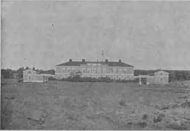
1. Vanha postitalo meren rannalla Eckerön pitäjässä

Lehtemme viime (marraskuun) numerossa oli kirjoitus Ahvenanmaasta. Kirjoitukseen liittyi eräitä kuvia, jotka osoittivat kuinka kaunis ja kukoistava se