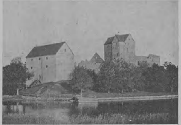
4. Vanha linna, Kastelholm Sundin pitäjässä