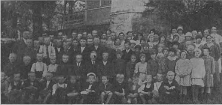
Mikkelin kuurojenkoulun oppilaat huvimatalla Porrassalmella