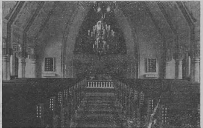
Marianhamin kirkko sisältä