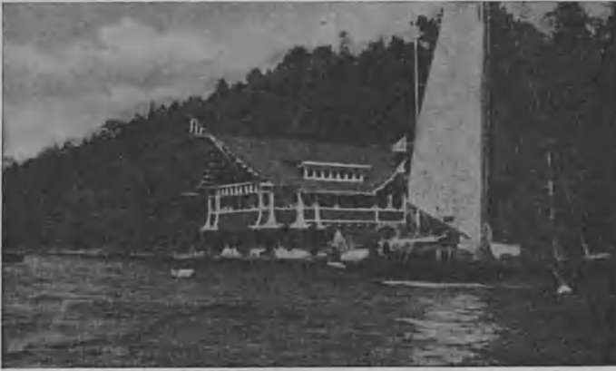
Purjehdusseuran maja Marianhaminassa