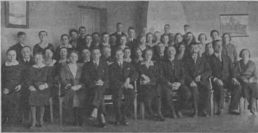
Vaasan kuuromykkäin urheiluseuran perustavasta kokouksesta 5. 3. 32

Johtokunnan kesken valittiin varapuheen-