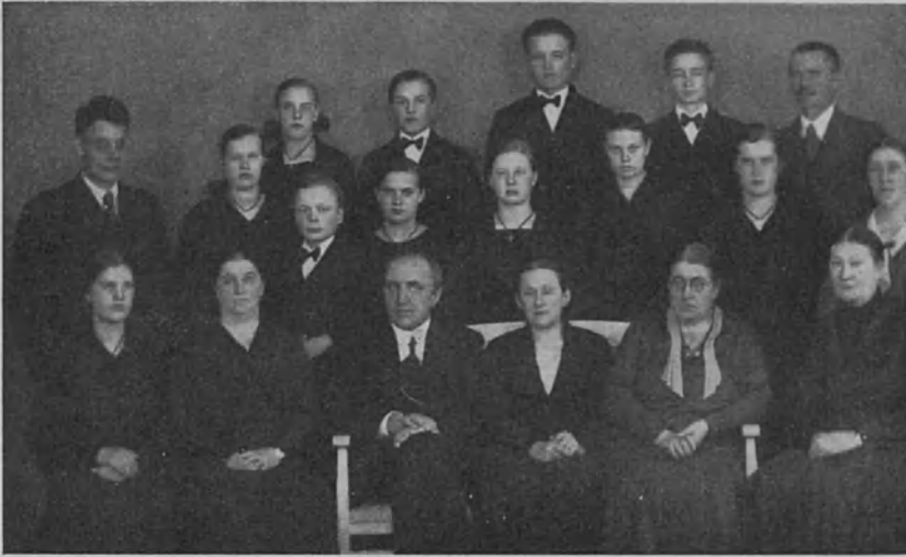
Oulun kuurojen- koulusta

suunta ja valittava itsellenne toimiala, jossa itse kukin tekee työtä itsensä ja kanssaihmistensä hyväksi. Tätä valintaa tehdessään on jokaisen hyvä ottaa huomioon, mille alalle hänen oma luonteensa ja taipumuksensa häntä ohjaavat. Silloin on takeita siitä, että hän ammatissaan saavuttaa tarpeellisen taidon ja kätevyuden. Tärkeätä on tietysti, että kukin löytää itselleen sellaisen toimialan tai ammatin, josta hän voi saada itselleen mahdollisimman hyvän toimeentulon, mutta vielä tärkeämpää on, että ammatti on sellainen, että se hänelle, kuuromykkälle, hyvin soveltuu ja että hän siinä voi saavuttaa mahdollisimman suuren taitavuuden. Sillä ihmisen arvoa ei nykyaikana enää mitata paljonkaan sen mukaan, mitä työtä hän tekee, vaan paljon enemmän sen mukaan, kuinka hyvää työtä hän pystyy tekemään omalla alallaan.