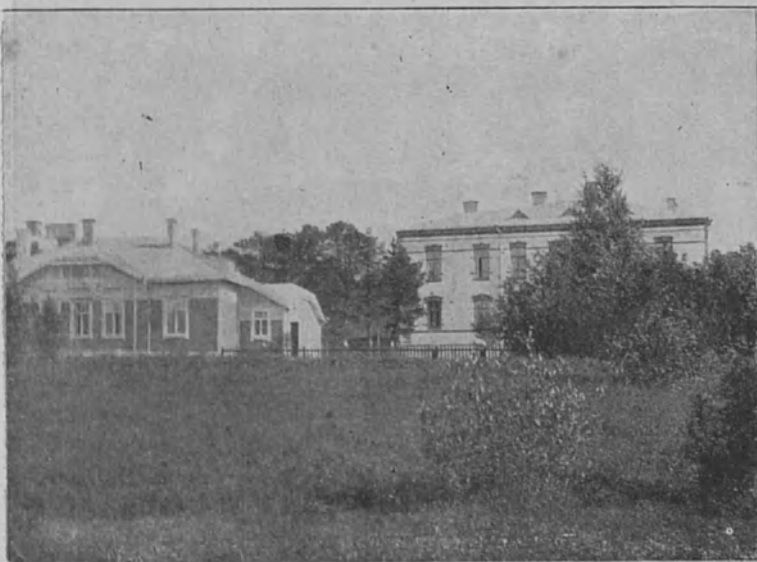
Oulun kuurojenkoulun johtajan asunto

Eilen sattui täällä koululla tapaus, joka pakoitti minut pelolla ja syvällä osanotolla ajattelemaan teitä. Eräs entinen toverinne tuli tänne ryysyisiin vaatteisiin puettuna, väsyneenä ja nälkäisenä. Kun hän oli saapunut koulun asuntolaan, niin hän retkahti lähimmälle tuolille ja purskahti itkuun. Hänen itkussaan oli yhtä paljon toivotonta surua kuin iloa siitä, että hän oli päässyt ystävien turviin. Hän oli useita