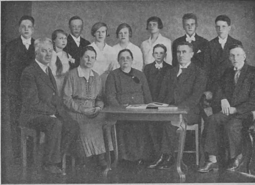
Porvoon ruotsinkielisestä kuuromykkäin- koulusta

rakkautemme kuuromykkiin ja heidän asiaansa elää meissä niin kauan kuin sydämemme jaksavat sykkiä.