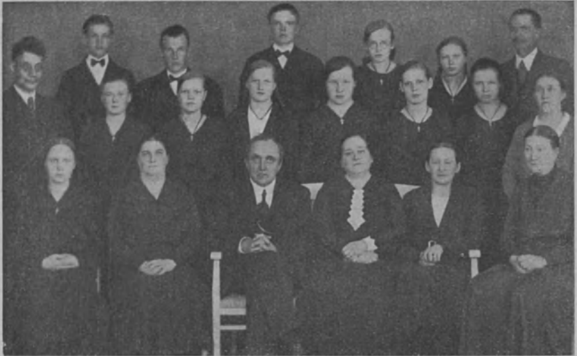
Oulun kuurojen- koulusta

olette harhaan joutuneet. Ja ehkäpä opettajainne hyvät elämänsuuntaa antavat opetuksetkin aina joskus palautuvat mieliinne antaen teille siveellistä tukea niissä vaaroissa, joita tulee eteenne nuoruusikänne kukkivilla poluilla.