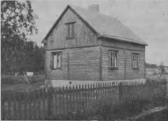
V. Salomaan huvila Keravalla

Alla esitämme kuvan Väinö Salomaan huvilasta. Se on rakennettu v. 1929 omalle 1,850 m 2 suuruiselle tonttimaalle Keravan kauppalassa, lähellä rautatieasemaa. Huvilassa on 2 huonetta ja keittiö.