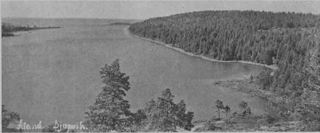
Kappale kaunista Suomea Ahvenanmaalta