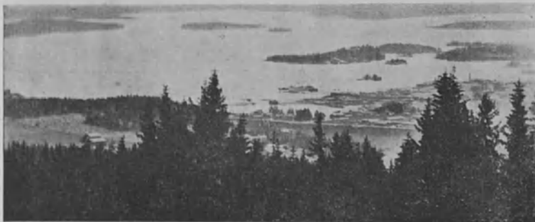
Kuopio. Näköala Puijolta Kallavedelle

Te olette nyt saavuttaneet ikäkauden, jolloin teidän kaikkien on määrättävä elämänne