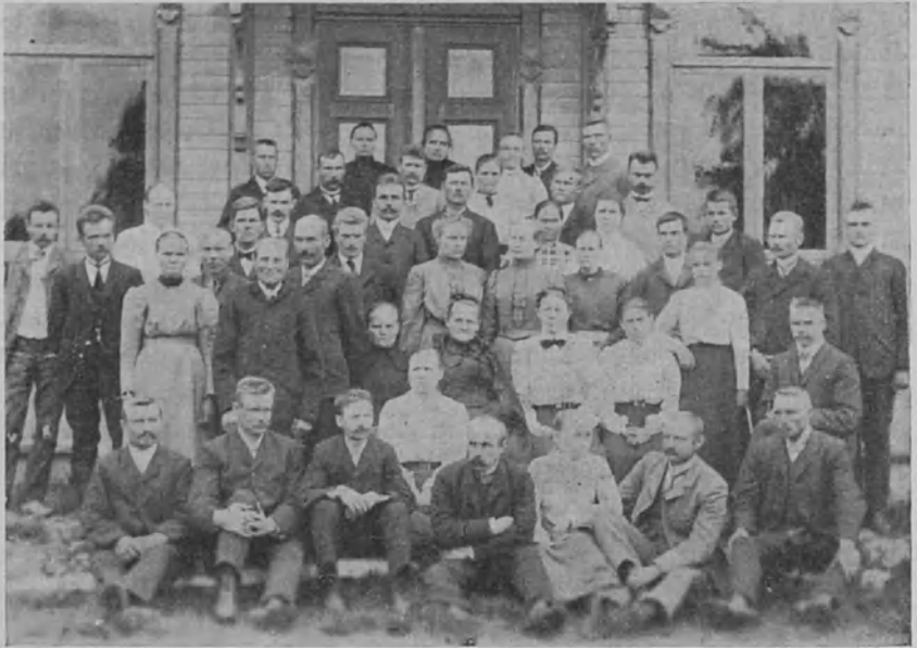
Heffatan perustajia v. 1907 (Kts. selostusta siv. 95)