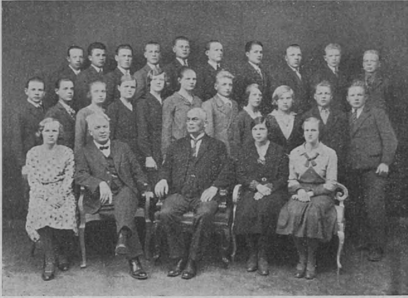
Turun kuurojen- koulusta

kuukausia sitten lähtenyt erääseen kaukaisen pitäjään sukulaistensa luo työhön. Kyllä hän oli työhön päässytkin, mutta vain ruokapalkoilla. Kun hän noin viikko sitten oli huomauttanut siitä, että hän tarvitsi vähän vaatteita, niin hänelle oli sanottu, ettei sellaisia voitu antaa. Hänelle sanottiin myös, että hän aivan kernaasti saisi lähteä tiensä.