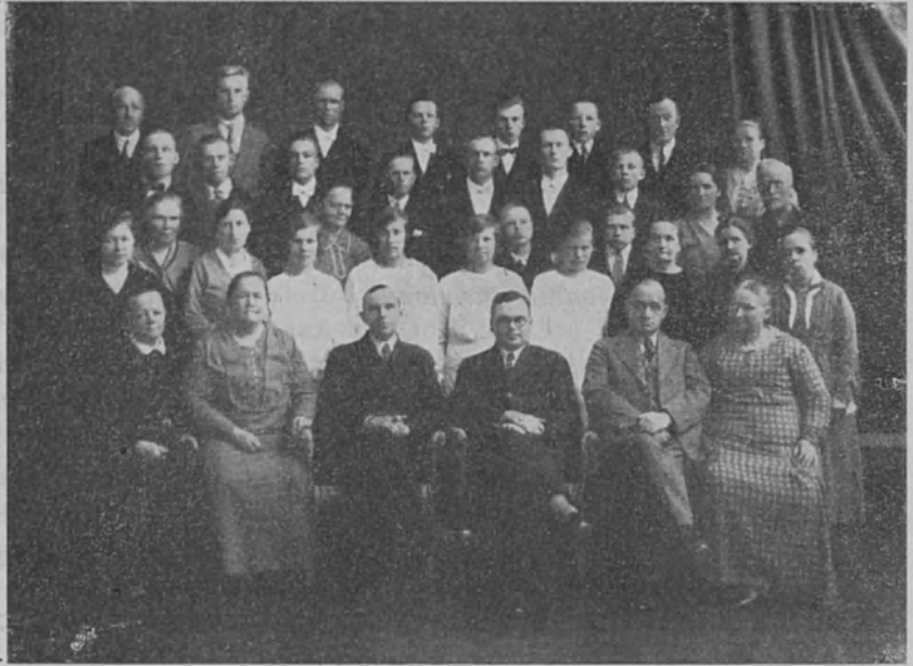
Jyväskylän kuuromykkäin- koulusta

niin kaikki tuntuu niin turhalta työttömän mielestä, jolta välttämättöminkin puuttuu.