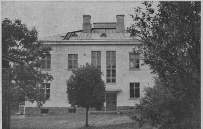
Porvoon kuuromykkäin koulun pihalta

Kuva esitti kesäisen luonnon helmassa pihamaalla istuvaa nuorta tyttöä avoin kirja polvillaan. Hänen edessään istui