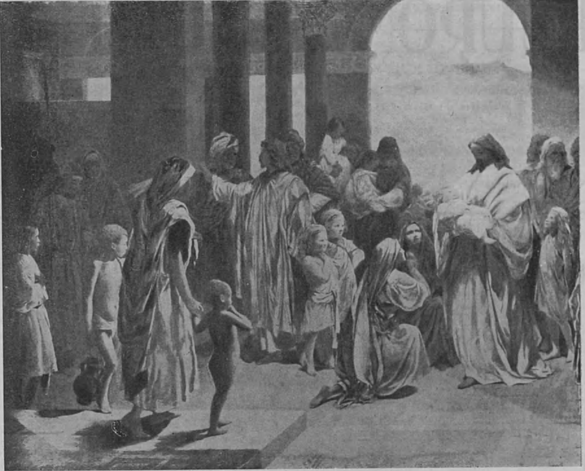
Jeesus siunaa lapsia

tamat köyhtyivät ja tulivat onnettomiksi kun olivat luopuneet pois Jumalasta. He kuolivat ja heidän sielunsa joutui hukkaan.