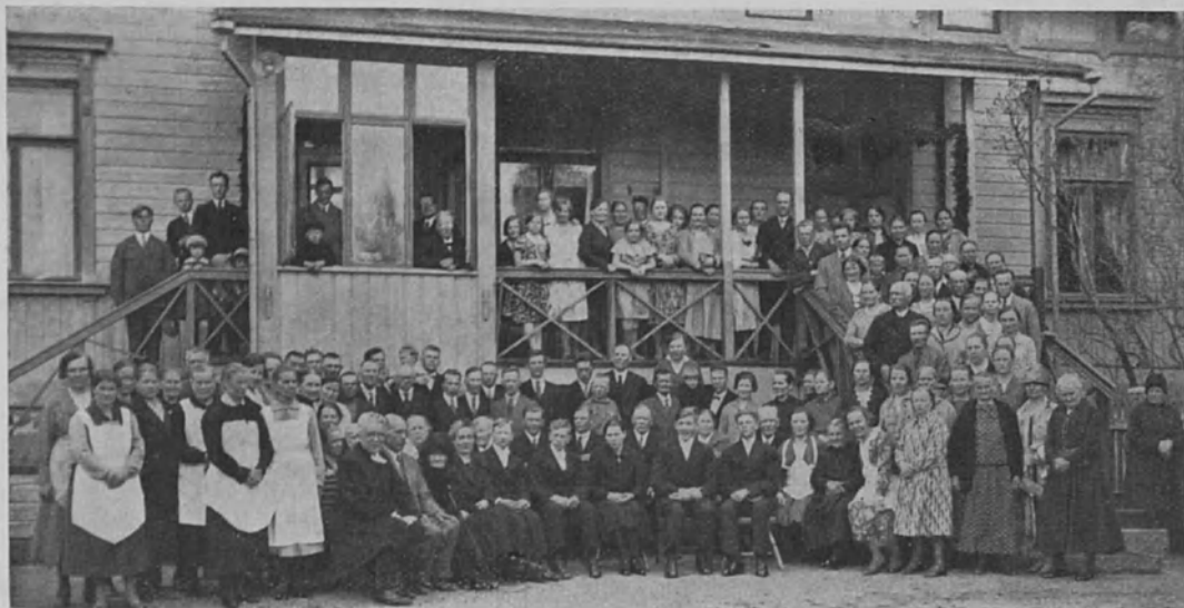
Juhlayleisöä Pietarsaaren kuuromykkäinkoululla