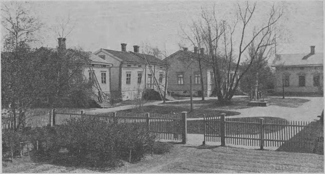
Pietarsaaren nyt lakanneen kuuromykkäinkoulun rakennukset