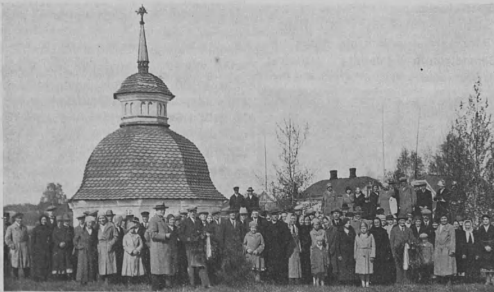
Juhlayleisöä Pietarsaaren vanhalla kirkkomaalla