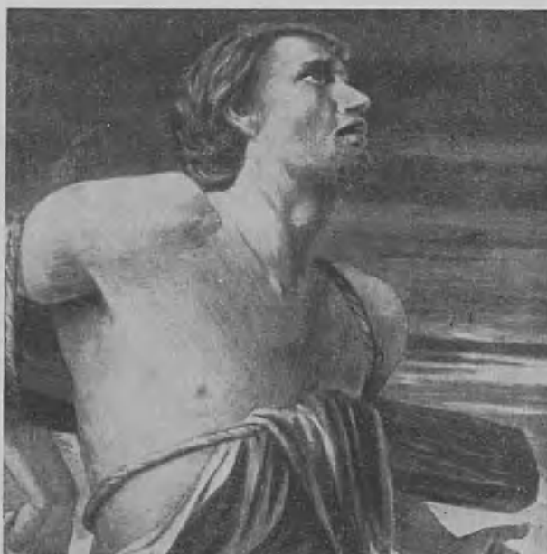
Katuvainen ryöväri ristillä.

Kehoitukseksi väsymättömään ja vakava-henkiseen työhön jäsentensä hyväksi päätti Liiton keskushallitus jouluksi antaa rahalahjan erälle haaraosastoille etupäässä oman kodin hankkimiseksi. Näitä apurahoja saivat suurimmat ja vanhimmat haaraosastot, jotka juuri nyt ponnistelevat voimiaan oman huoneuston saamiseksi, nimittäin Helsinki 2,000 mk, Pori 1,000 mk, Turku 1,000 ja Tampere, jolla on vaikeuksia huoneustovuokran