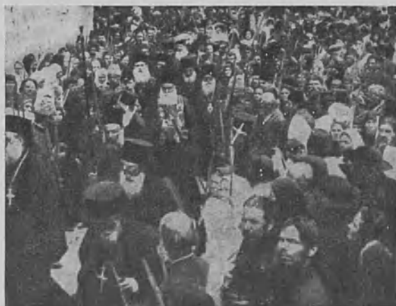
Pääsiäisjumalanpalvelus Jerusalemin kirkossa.

Yllämainitun aiheen johdosta ei minulla ole omasta kokemuksestani vielä kovin paljon kerrottavaa. Koska olen vielä nuori, ei ole kuurodestani vielä pitkää kokemusta, siihen verraten, mitä tietävät ne, jotka ovat saaneet jo vuosikymmeniä tuntea kuuron kovaa kohtaloo.