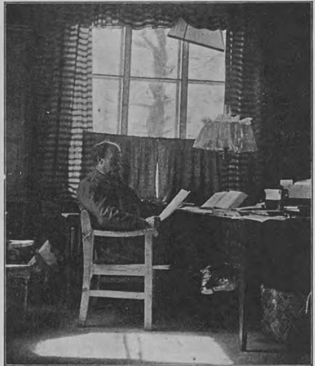
Suomennostyössä „raamattupöydän“ ääressä

tätä pitää mestariteoksena. Tätä ennen kirjoitti Aho jo teokset nimeltään: "Esimerkin vuoksi", "Helmännin herra", "Helsinkiin" ja "Yksin", jonka hän kirjoitti ensimmäisellä Pariisiin matkallaan ja joka ilmestyessään v. 1890 herätti suurta huomiota. Juhani Aho on julkaissut myöskin useita kertomuskokoelmia, joita kutsutaan "Lastuiksi". Muutamissa Lastuissaan hän kuvailee luontoa ja toisissa taas surumielisellä tavalla sekä ihmisten että eläinten sielunelämää. Tavallisesti niissä on elämän toiminta asetettu tosiolojen mukaan, kuvaten karkeaa todellisuutta, mutta toisissa kertomuksissaan Aho on kyllä käyttänyt mielikuvitusta ja tunnettakin apunaan. Lastujen kieli on kauttaaltaan mehevää, soinnukasta ja kuvarikasta. Nämä pienet kirjalliset tuotteet, lastut, ovatkin saaneet yleisön suosion osakseen. Myöhemmin Aho rupesi kirjoittamaan vanhoista historiallisista aiheista. V. 1897 ilmestyi häneltä romaani "Panu", joka kuvaa pakanuuden ja kristinuskon viimeisiä taisteluja Raja-Karjalassa. Teoksessa esiintyy tietäjä Panu, joka viimein sortuu taistelussa kristinuskoa vastaan. Erinomaisella taidolla on tässä kirjassa kuvattu Karjalan saloseutujen talvista luontoa sekä pakanuudenaikaista, kalevalaista elämää. Virkavallan sortotoimenpiteet ja talonpoikain keskuudessa syntyneet herännäisyysliike ilmenevät Ahon laajassa kaksiosaisessa romaanissa "Kevät ja takatalvi". Tässä teoksessa saa lukija tehdä