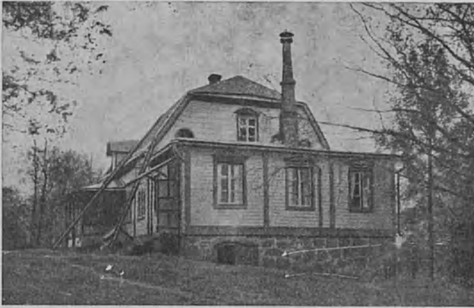
lisalmen pappilan pohjoispäätty