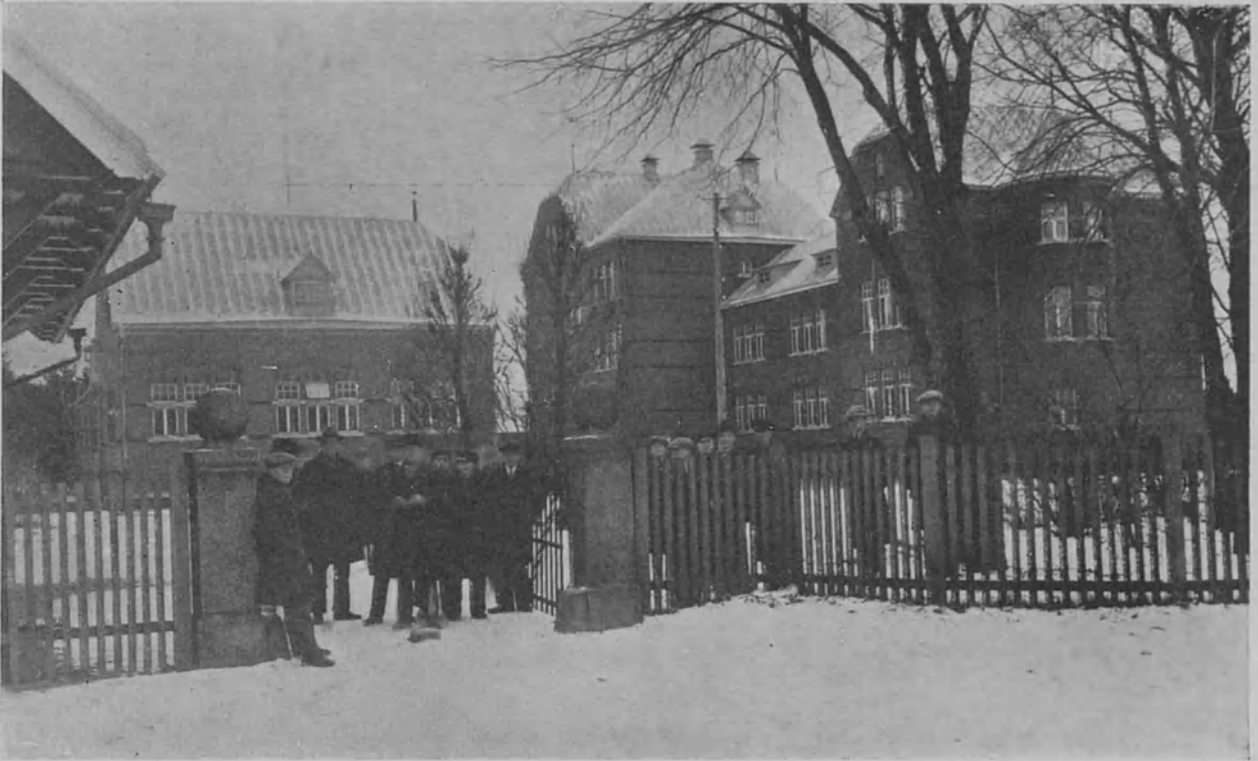
Vänersborgin kuuromykkäin ammattikoulu