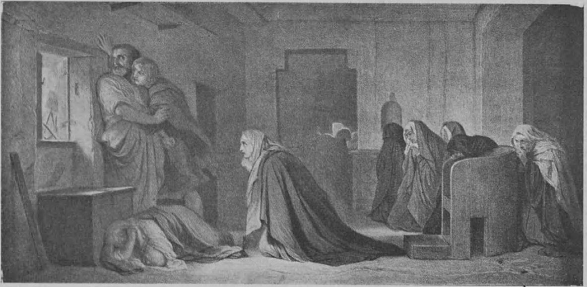
Jeesuksen ystävät kokoontuneina katsomaan ristiinnaulitsemista Pitkäperjantaina

Jeesuksen työ maan päällä oli täytetty. Hän oli tullut ollakseen Jumalan Karitsa, joka kantaa maailman synnin. Ja Jumala oli pannut kaikki meidän syntimme hänen päälleen. Nyt oli hän haavoitettu meidän pahain tekoimme tähden; ja meidän synteimme tähden oli hän hosuttu. Rangaistus oli hänen päällensä; ja tämä kaikki tapahtui sentähden, että meillä olisi rauha. Nyt oli hän valmis. Uhri oli toimitettu. Synti oli sovitettu. Rangaistus oli kärsitty. Avattu oli ihmisille tie taivaaseen. Se on täytetty, sanoo hän itse. Kaikki on valmista. Taivaan ilo on tarjona syntisille ihmisille.