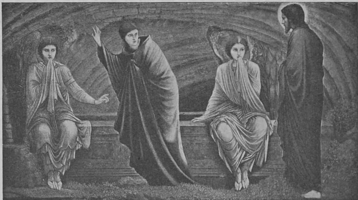
Ylösnoussut Jeesus ilmestyy Marialle Pääsiäisenä

kaikkien synnit levätä hänen päällään. Sinunkin syntisi. Ja muista, että hän sanoo sinullekin: Se on täytetty! Minä tulin haavoitetuksi sinun pahojen tekojesi tähden; minä tulin hosutuksi sinun syntiesi tähden. Rangaistus oli minun päälläni, että sinulla olisi rauha. Etkö tahdo panna käsiäsi ristiin ja sanoa: Herra, anna minun nähdä pelastus; anna minun nähdä, että tie taivaaseen on minullekin avoinna?