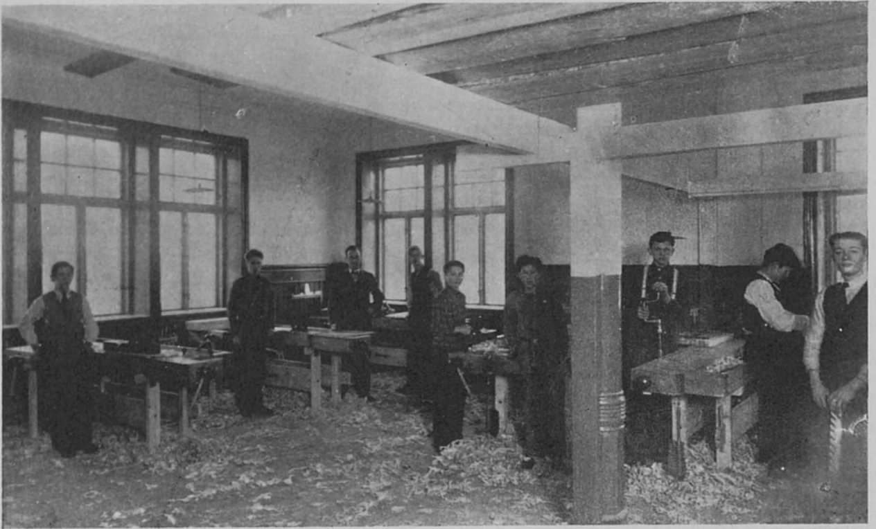
Puuseppien työhuone Vänersborgin k.m. ammattikoulussa