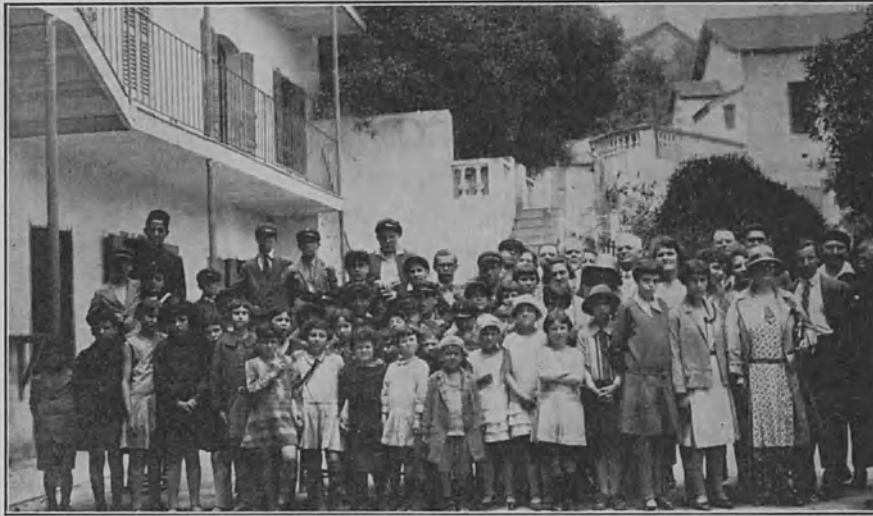
Kuuromykkäinkoulu Algerissa, Pohjois-Afrikassa

rin maakunta on noin 20 kertaa suurempi kuin koko Tanskanmaa. Juhlavalaistuslaitteita näkyi kaikkialla kaupungin kaduilla, puistoissa y.m. Melkein joka ilta oli kaupungissa ilotulitus. Hauskaa oli sitä katsella niinkuin komeita palmupuitakin, joita kasvoi joka suunnalla. Algerin Ranskaan yhdistämismuistojuhlat kestivät tammikuun alusta kesäkuun loppuun saakka! Juhlain loputtua alkoi kuumuus vaivata. Se on yleensä pahimmoillaan heinä- ja elokuussa. Silloin