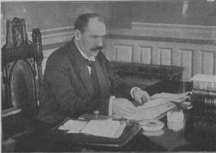
Ent. valtionhoitaja P. E. SVINHUFVUD, uusi presidentti

Keisarin käskystä hänet erotettiin tuomarin virasta, vangittiin ja vietiin kauas Siperiaan maanpakoon. Siellä oli hän liki 3 vuotta ja pääsi vapaaksi vasta Venäjän vallankumouksen tapahduttua kun keisarivalta oli kukistettu. Tyynenä ja lujasti oikeuden voittoon luottaen kesti Svinhufvud