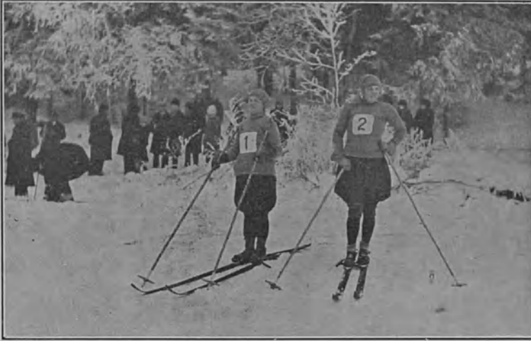
Hiihtomestaruuskilpailujen naispuoliset osanottajat Helsingissä 1929

paljoa maksa ja lumikenttiä ei tarvitse kaukaa etsiä — oman nurkan takaa monesti jo pääsee latunsa aukaisemaan puhtoiseen hankeen. On oikeastaan ihme, että löytyy sellaisiakin joukossamme, jotka eivät halua käyttää hyväkseen tätä talvisen luontomme tarjoamaa monipuolista ja hauskaa urheilumuotoa.