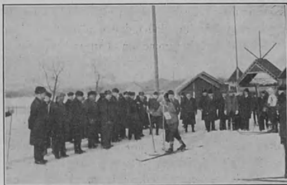
Hiihtomestaruuskilpailut Turussa 1928

Olemme nyt saaneet oikein ihanteellisen talven, joka suo mitä parhaimmat mahdollisuudet hiihdon harjoittamiseen. Hiihtohan on — tai ainakin pitäisi olla — kansallisurheilumme, jota voi harjoittaa kuka tahansa, nuori tai vanha, mies tai nainen, omaksi terveydekseen ja virkistyksekseen. Hiihtovälineet eivät