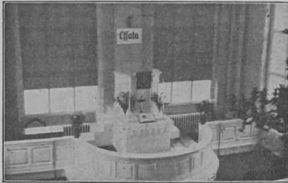
Helsingin kuurojen kirkko ennen

tomasti ilman mielenhartautta. Kiitollisia olemme, että on senkin verran saatu vakavaa uskonnollista sisältöä "seurakuntailtoihimme". Mielellämme ottaisimme sellaista enemmän jos saisimme.