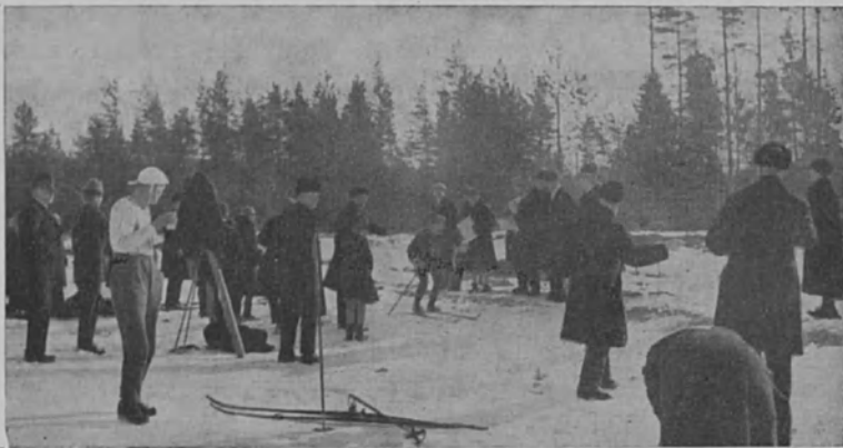
Hiihtomestaruuskilpailut Jyväskylässä 1930

kaisen tunteman vaikean ajan takia on liiton ollut pakko luopua tähänastisista arvoesinepalkinnoista ja siirtyä käyttämään palkintoina kauniita ja arvokkaita kunniakirjoja , jollaisia m. m. Työväen Urheiluliitto on jo vuosikaudet käyttänyt kaikissa kilpailuissaan ilman että osanottajamäärä olisi alentunut taikka tulostaso laskenut. Toivottavasti meidänkin hiihtäjämme ymmärtävät suhtautua asiaan oikealla tavalla ja saapua entistä runsaslukuisemmin naisissa ja miehissä Hämeenlinnaan mittelemään voimiansa terveellisessä hiihtourheilussa. Liitto tulee nyt niinkuin ennenkin pyytämään 50 % alennuksen rautatiepiletien hinnoista sinne saapuville osanottajille ja liiton jäsenille. Ja nuori ja yritteliäs Hämeenlinnan Kuuromykkä-Urheilijat-seura puolestaan panee parhaansa kilpailujen kaikinpuoliseksi onnistumiseksi. Katsokaa ilmoitusta lehtemme takasivulla! Niin että toivotaan nyt Hämeenlinnan kilpailuille niin osanottaja- kuin yleisömäärään nähden parhaita menestystä.