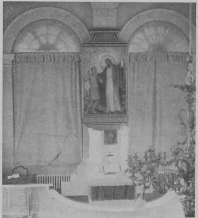
Helsingin kuurojen kirkko nykyisessä asussaan

Meillä suomalaisilla kuuroilla täällä Helsingissä on syytä olla iloiset siitä, että meillä kirkkomme kaunistuksena on taiteellisesti arvokas ja kaunis alttaritaulu. Se kohottaa meidän mieltämme hartauteen kun kirkkoon saavumme ja istumme penkillä odottamassa jumalanpalveluksen alkamista. Sen katseleminen herättää meissä kauniita ajatuksia. Me unhotamme silloin mielestä ruman ja pahan ja muistelemme Jeesusta, jonka kuvan näemme taulussa. Tämä taulu kestää vuosisatoja. Me nykyinen polvi, menemme pois, painumme hautaan, mutta taulu jää paikoilleen. Se kertoo tulevien aikojen kuuroille ja muillekin, kuinka Helsingin k.m. ennen hankkivat tämän taulun Jumalan kunniaksi kuurojen jumalanpalveluksia juhlistamaan ja heitä muistuttamaan parhaasta auttajasta Jeesuksesta Kristuksesta. Kirkkomme on todella kaunis nykyisessä asussaan. On mieluista avata kirkon ovi ja viivähtää siellä ne hetket, jotka kuluvat jumalanpalvelukseen. Kuurot yleensä käyvätkin kirkossa tyydyttävästi. Varsinkin vanhemmat, viittomakieltä puhuvat kuurot käyvät säännöllisesti joka sunnuntai-