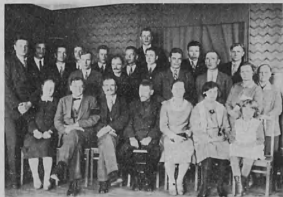
Lahden k.m. yhdistyksen perustava kokous 5/10 -30.