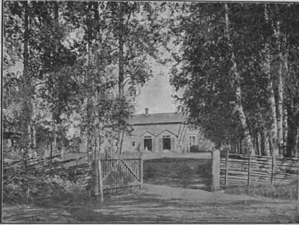
Vanha Nikkarila neiti Bovalliusten aikoina.

serkkunsa rovasti Borg — kuuromyökkäin hyvä ystävä — oli ohjannut ajattelemaan juuri kuuromyökkäiä. Myöskin kouluneuvos Forsius oli kehoittanut neiti Bovelliusta panemaan täytäntöön sen kauniin suunnitelman, jota sisarukset olivat yhdessä ajatelleet. Näyttää siltä niinkuin kuuromyökkäin avuton tila olisi Pieksämäellä ollut erikoisen tunnettua, sillä on olemassa toinenkin, Pieksämäen kunnalle tehty testamentti, jossa on määräys kuuromyökkäin kouluuttamisesta.