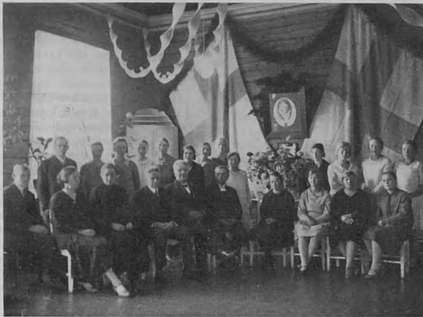
25-vuotisjuhla Nikkarilan talouskoulussa