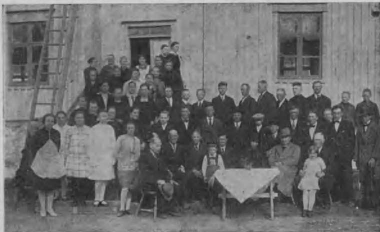
Kuuromykkiä kokoontuneena jumalanpalvelukseen Pietarsaassa 18. 5. 1930.

PIETARSAAREN K.M. YHDISTYKSEN KESÄJUHLA. Kuvassa näemme Pietarsaaren ja sen ympäristön kuurot kokoontuneina jumalanpalvelukseen ja samalla kesäjuhlaan Pietarsaaren k.m. koululle viime toukokuun 18 p:nä. Kuten näkyy kuvassa on sillä paikkakunnalla paljon kuuroja ja on heidän yhdistyksensä hyvässä toiminnassa. Sikälaiset kuurot ovat miltei kaikki käyneet ruotsinkielisen koulun,