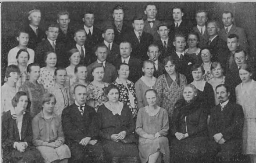
Kuopion jatkokurssi- laiset opettajineen