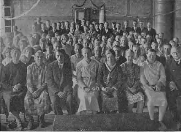
Seinäjoen ja sen ympäristön k.m. piirikokouksesta 6/7 -30.

jana pidetty. Nyt ei k.m. ole pitkiin aikoihin ollut naispuolista matkapuhujaa. Elämässä on ilmennyt paljon uusia virtauksia, jotka koskevat naista. Naiseen pannaan nyt paljon enemmän huomiota kuin ennen, siksi, että juuri nainen voisi suureksi osaksi olla välikappaleena siveellisen elämäntason kohottajana. Mutta se ei käy laatuun, ennenkuin naiset on saatu herätyksi ymmärtämään mikä voima heissä piilee hyvään ja pahaan. On paljo asioita, joita on vaikea selostaa kirjoittamalla k.m. lehteen. Monelle jäävät sittenkin monet kohdat tuntemattomiksi. Mutta nainen joka on hyvin perehtynyt naisasian eri puoliin ja elämän moninaiisiin siveellisiin kysymyksiin voisi matkapuhujana vaikuttaa jotain kanssasisariinsa. Siinä sivussa voisi hän myös pitää ainakin yhden esitelmän molemmille sukupuolille yhteisesti tai, jos hän kykenee, myös erikseen miehille. — Mitä siis sanotte jos ehdottaisimme että Liittomme johtokunta ajattelisi tätä asiaa ja asettaisi jonkun yllämainittuja asioita harrastavan naisen matkapuhujaksi k.m. naisille. Useille olisi mieluista saada k.m. nainen siihen paikkaan kuten oli ennenkin. Silloin suhde puhujan ja yleisön välillä olisi välittömämpi ja vapaa. Toivoisimme kuitenkin, että jotkut toisetkin paikkakunnat antaisivat lausuntonsa tähän lehteen, että sen nojalla voitaisiin ryhtyä toimenpiteisiin.