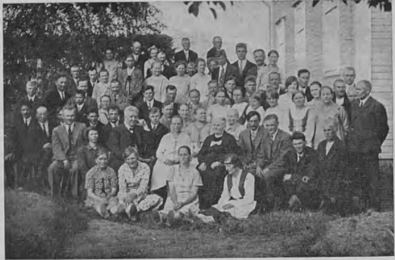
Kokemäen jokilaakson kuurot kokoontuneina yhteiseen kesäjuhlaansa Kokemäelle Viinikan taloon 28/6 -30.

Jos Suomen kuuromykille perustettaisiin korkeampi oppilaitos (esim. lyseo tai yliopisto) löytyisi paljon vaikeuksia ja ylivoimaisia esteitä, sillä maamme valtio on köyhä ja maassamme löytyy kovin vähän lahjakkaita, itsetietoisia k.m., jotka voitaisiin tähän korkeampaan oppilaitokseen ottaa. Sitäpaitsi on suurin osa kuuromykistä vähävaraisista perheistä, jotka eivät itse voisi kustantaa koulutustaan. Myös valtion virkoihin löytyy kuulevia pyrkijöitä ylen runsaas-