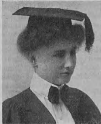
Helen Keller Amerikalainen ylioppilaslakki päässään.

Helen oli harvinaisen hyvä-päinen ja lahjakas oppilas, joka mitä suurimmalla halulla ja uteliaisuudella tahtoi oppia tietämään, tuntemaan ja taitamaan kaikkea. Aluksi opetettiin häntä sormiaakkosilla siten, että aakkosilla puhuttiin hänen käteensä. Paljon käytettiin opetuksessa luonnollisestikin viittomia. Pian oli oppilaalla "kieli" niin vallsaan, että hän rupesi opiskelemaan m. m. laskentaa, maantietoa, luonnontietoa y.m. Mutta neiti Sullivan, joka oli kuurojen opettaja ammatiltaan, opetti oppilaansa puhumaan suullakin ja ymmärtämään toisten puhetta siten, että hän