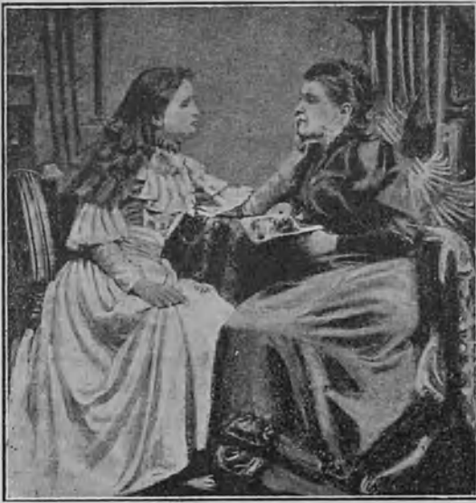
Anna Sullivan opettaa Helen Kelleriä

min sanotaan hänen suorittaneen tohtorin tutkinnon eräässä Amerikan yliopistossa.