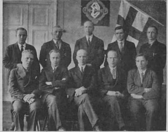
Liittoneuvoston kokous 19. 4. 30

Ensi elokuun 16—17 päivänä vietetään Lahdessa varsinaiset KUL:n kymmenvuotisjuhlat mestaruuskilpailujen yhteydessä, joihin koko maa voi osallistua. Näkemiin siellä! Yksi joukosta.