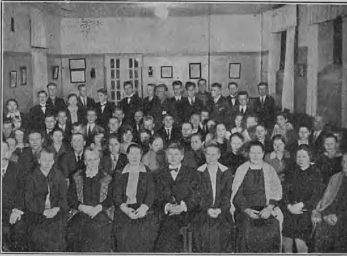
Viipurin k.m.y:n 30-vuotisjuhlasta.

siellä aina silloin tällöin tavataan ja vaihdetaan ajatuksia kahvipannun kiehuessa. Pian huomaa kenen kanssa on hauska seurustella. Muodostuupa pianikin pikku tuttava- ja ystäväpiirejä, jotka tuontuostakin kokoontuvat kultaisen kahvipannun ympärille. — — Joskus tulee sitten "viikatemies" (kuolema) hajoitetaan ystäväpiiriin — — — mutta siitä en nyt tahdo puhua — — —.