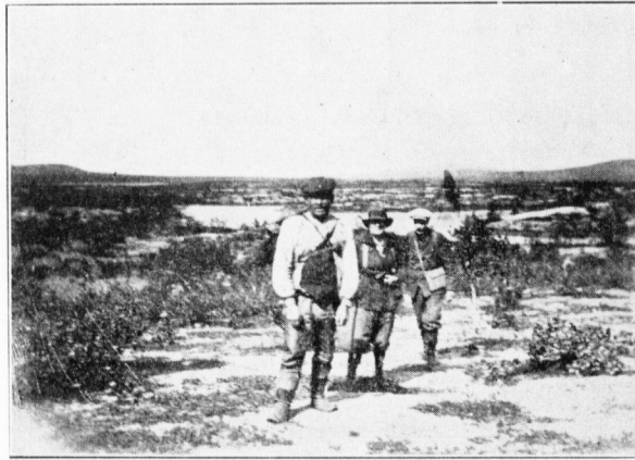
Enontekiön polttomassa tunturimaassa Norjan rajoilla.