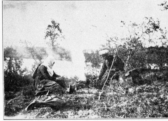
Levähdys Nikkälän tunturijärven rannalla Lapissa.