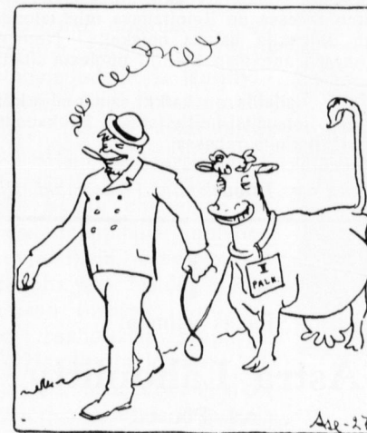
Isäntä palaa Lahden näyttelystä.