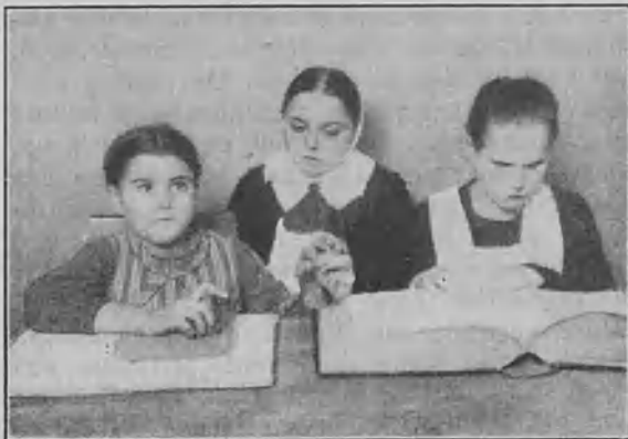
„Hänen käteensä puhuu opettaja sormiaakkosilla“ — — —