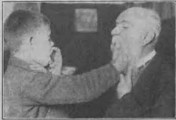
„Oppilas tuntee opettajan kurkunpään vieron tärinän“ — — —

Suurissa sivistysmaissa, missä aistiviallisten opetus jo pitkät ajat on korkealle tasolle kehittynyt on sokeain kuuromykkäin opetuksessakin päästy kauniisiin tuloksiin. Niinpä esim. Saksassakin on jo kauan sitten kiinnitetty huomiota sellaisiinkin onnettomiin lapsiin, joilta puuttuu sekä näkö- että