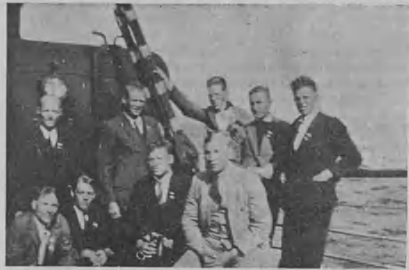
Suomalaiset k.m. urheilijat kyntävät Itämeren „Oberon“- laivassa.