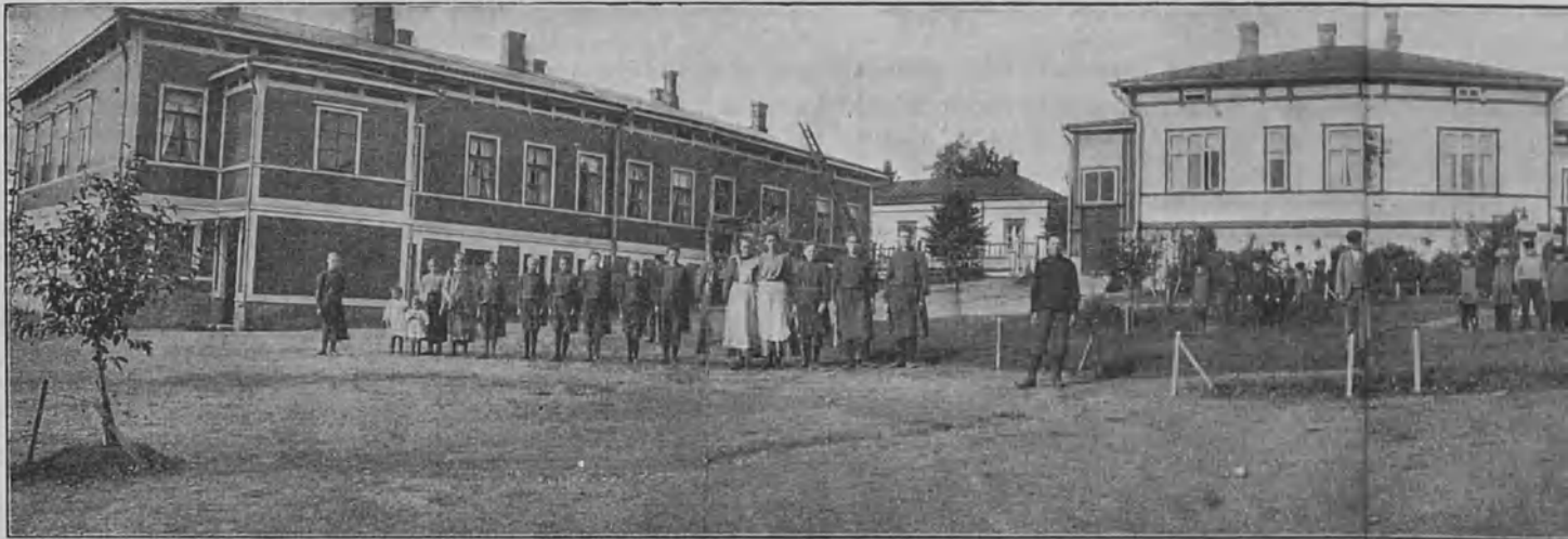
Porvoon k.m. koulu, joka nyt avaa ovensa Suomen yhdeksännelle k.m. lle ja jonka pihan

valistustyötä. Siellä huomasi uhrautuvaisuutta toisten, kovempiosaisten hyväksi. Ja aina sinne saapuu runsaasti kuuromykkiä ympäri koko Lounais-Suomen ja kauempaakin.