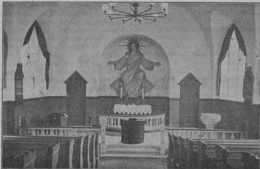
Köpenhaminan k.m. seurakunnan kirkko sisältä.