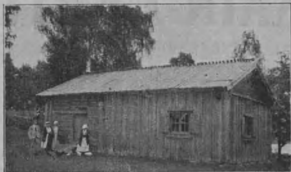
Paikkarin torppa Sammatissa.