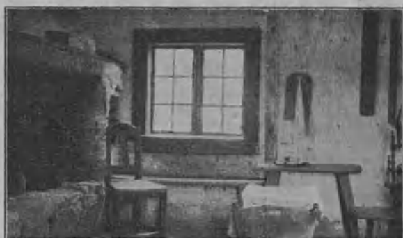
Paikkarin torpan tupu, jossa Lönnrot syntyi.

Vielä pari vuotta eli Lönnrot 80 vuotispäivänsä jälkeen. Niitten vuosien kuluessa väsyi hän vähitellen vaikka aina koettikin olla työssä.