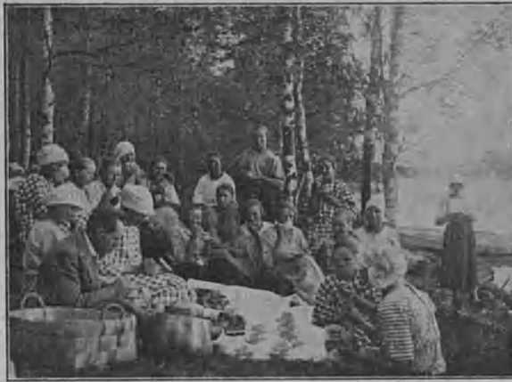
Nikkarilan tytöt huvimatalla.

pailla siitä, kenen viikolla on enimmän munia pe- sistä löytynyt.