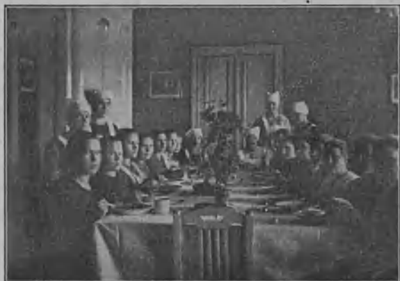
Joulu Nikkarilassa v. 1924.

Menimme kaikki huoneisiimme muuttamaan vaatteita. Mieleni oli levoton ja jännityksessä. Ei tahtonut tulla mistään valmista. Kokoontuimme kaikki keittiöön. Tytöt lentelivät edestakaisin, toiset kattoivat pöytä ja toiset laittoivat ruokaa. Kello 7 söimme jouluillallisen kukilla koristetun pitkän pöydän ääressä. Sitten autoimme keittiö- emäntiä astiain pesussa. Kun kaikki oli valmista, saimme luvan mennä juhlasaliin. Kahta kertaa ei meitä tarvinnut käskä. Kuusi näytti niin kau- niilta kynttilöineen ja koristeineen. Ensin johta- jatar luki kauniin joulukertomuksen. Sitten joimme