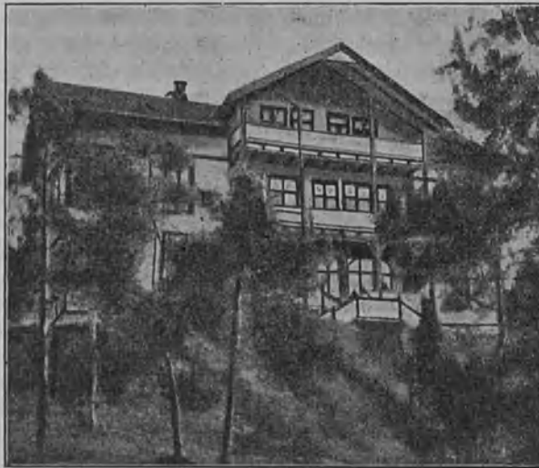
Kristianian k.m. vanhainkodin toinen päärakennus.

kenttä aivan niin lähellä, että ei luulisi olevan mahdotonta matkustajien juosta leikkimään lumisotasilla keskellä kesää junan pysähtyessä asemalla. Fokstuan ja Hjerkin-nimisten asemain luona esim. kulki juna yli tuhat metriä merenpinnan yläpuolella. Välistä taas ajoi juna korkean vuoren sisään, pimeään tunneliin. Ei osaa kynä kertoa miten kaunis tämä matka Dovre-vuoristossa on. Meidän innostuksemme ja ihailumme oli valtava. — Etelämmässä vasta lähemmä Kristianiaa tullessa muuttui