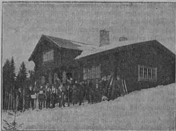
Kristianian k.m. hiihtomaja.