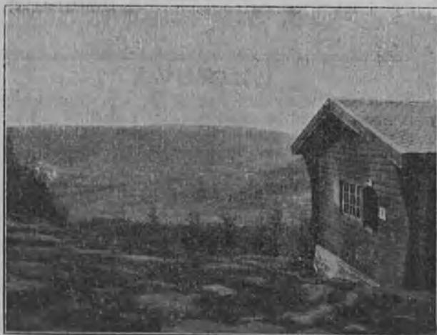
Näköala Kristianian k.m. hiihtomajalta.

Nyt ovat molemmat retkeilyt siirtyneet muistojen joukkoon, jättäen parhaimmat muistot ja mo-