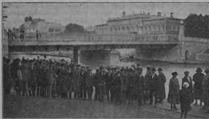
Lähtö Paraisiin Turun satamasta.