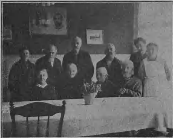
Tukholman vanhainkodin asukkaat.

jäsenet ovat maksaneet vuosittain jäsenmaksuja. Näin on saatu muutamassa vuodessa kootuksi yhteensä 34,000 kruunua (n. 340,000 mk.). Näin ollen on auttajayhdistyksen johtokunta päättänyt ryhtyä lopullisiin toimiin vanhainkodin avaamiseksi. Viime vuonna osti se valmiin huvilan 28,000 kruunulla maalta, n. 3 kilometrin päässä Härnösandista. Sen omisti eräs tukkukauppias ja on se hyvin rakennettu havumetsän keskelle korkealle mäelle, josta on kaunis ja laaja näköala yli kukoistavan maiseman etelään ja aavalle merelle päin. Huvilalla on isonpuoleinen maa-alue, jossa on puutarha ja viljeltyä peltoakin. Rakennus on 2-kerroksinen. Siinä on 7 huonetta, keittiö, eteinen ja ullakkoparvekkeita. Kellari, pesutupa ja varastohuoneita on alakerroksessa sekä erikoinen talonmiehen asunto. Mutta kotiin ei voida vielä kahteen vuoteen ottaa vanhoja. K. m. Yhdistyksen varat ovat vielä liian pienet. Sentähden on huvila toistaiseksi vuokrattu toisille asukkaille, jotka maksavat yhdistykselle suuren vuokran ja niin kartuttavat sen varoja. Toivotaan, että lähivuosina yhdistyksen varat kasvavat, niin että se voi ostaa huonekaluja y. m. mitä vanhainkoti tarvitsee. Ja sitten saavat monet Pohjois-Ruotsin vanhat k. m. itselleen hyvän ja rauhallisen vanhainpäivän kodin.