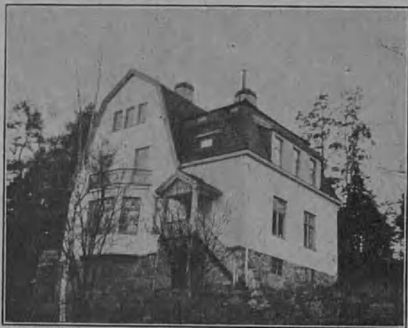
K. m. vanhainkoti Tukholmassa Lidingössä.

Tukholmaan perustettiin vanhain ja työhön kykenemättömän koti, yhteinen miehille ja naisille, jo 15 vuotta sitten. Tämä koti on tähän asti ollut