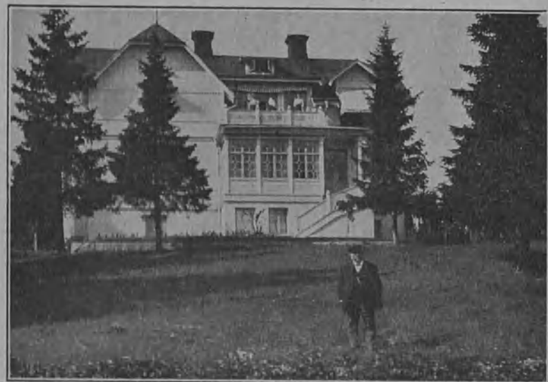
K. m. vanhainkoti Härnösandissa.

Pohjois-Ruotsiin perustetaan myös kohta uusi vanhainkoti kuuromyckille. Se tulee olemaan Härnösandin kaupungissa, missä Ruotsin pohjoisin k. m. koulukin on. V. 1917 lahjoitti nim. eräs nimeään ilmoittamaton henkilö 5,000 kruunua (n. 50,000 mk.) vanhainkodin perustamista varten pohjois-Ruotsin k. myckille. Härnösandin k. m. koulun opettajat ja toisetkin k. m. ystävät ovat tuota rahasummaa lisänneet vuosittain. Ompeluseura on toiminut sen hyväksi. On pidetty myyjäisiä, on kerätty rahaa, on perustettu auttajayhdistys, jonka