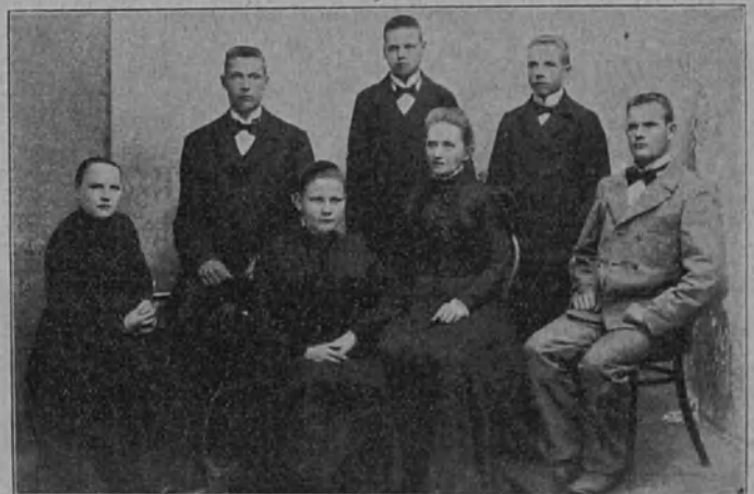
Ensimmäiset Mikkelin k.m. koulusta päässeet oppilaat v. 1900.

Kesäkoulua ovat opettajat pitäneet kaksi kertaa entisille oppilailleen. Tytöille pidettiin kesäkoulua kesäkuulla v. 1910 ja pojille kesäkuulla v. 1913. Runsaasti oli molempiin kursseihin saapunut koulun entisiä oppilaita.