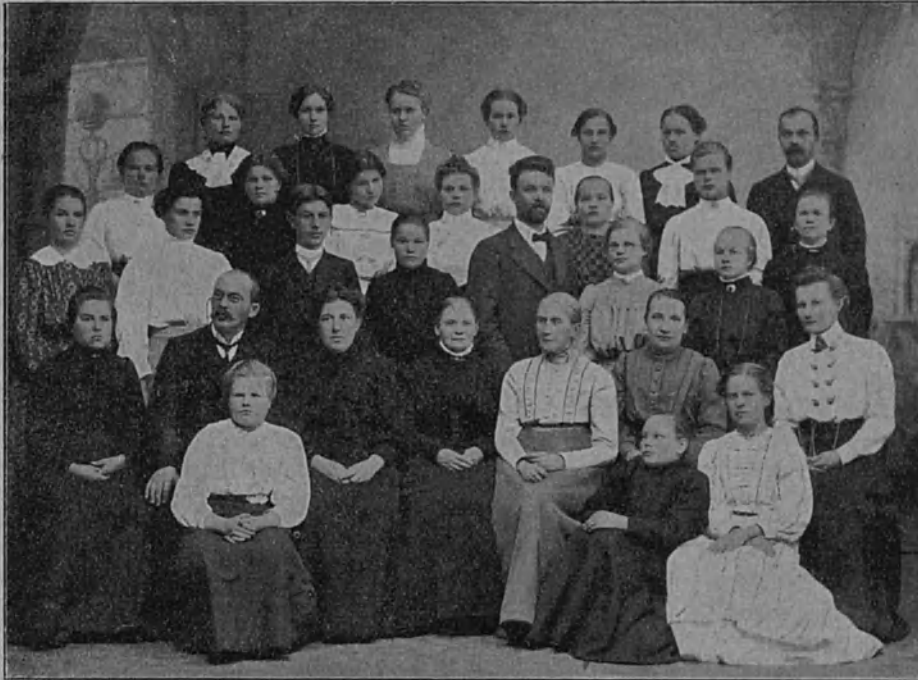
Jatkokurssit Mikkelin k.m. koulussa v. 1910.

neissa, Kiurun perillisten talossa. Uusi koulurakennus valmistui elokuulla v. 1900 ja syyskuun 1 päivänä v. 1900 alettiin työskennellä omassa, tilavassa ja ajanmukaisessa koulurakennuksessa. Asuntola, talusrakennus ja johtajan asunto valmistuivat vasta syyskuun 1 päivänä v. 1901.