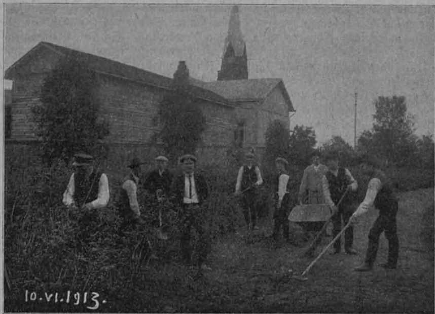
Oppilaat siistivät Mikkelin k.m. koulun pihamaata.

Jo monena vuonna on huomattu, että kuuromykkäinkouluissa lähimmässä tulevaisuudessa muodostuu pelottava opettajapula. Monet k. m. koulujen opettajat ovat tulleet vanhoiksi ja tahtoisivat erota toimestaan kun vaan saisivat sellaisen eläkkeen, että voisivat sillä elää. Kouluhallitus on laskenut, että 40 % kuuromykkäinkoulujen nykyisistä vakinaisista opettajista on jo pääsyt tahi pääsee ensi vuonna eläkeikään. Kuopion ja Turun k.m. kouluissa on tämä prosentti jo n. 55 ja ruotsinkielisessä k.m. koulussa 67. Muutamien vuosien perästä tulee luonnollisesti siis monet k.m. opettajat eroamaan vanhuuden tähden. Kouluhallitus on suurella levottomuudella huomannut tämän. Sillä mistä saadaan uusia opet-