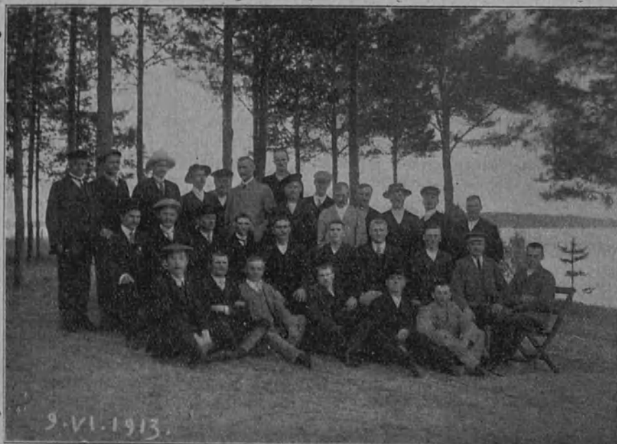
Poikain jatkokurssit Mikkelin k.m. koulussa v 1913.

K.m. koulujen opettajaksi voi päästä sellainen henkilö, joka on ensin seminaarissa suorittanut kansakouluopettajatutkinnon ja sitten 2 vuoden aikana josakin k.m. koulussa valmistunut ja suorittanut opettajakokeet y.m. tutkinnot tähän erikoisalaansa. Tällaiseen pitkäaikaiseen val-