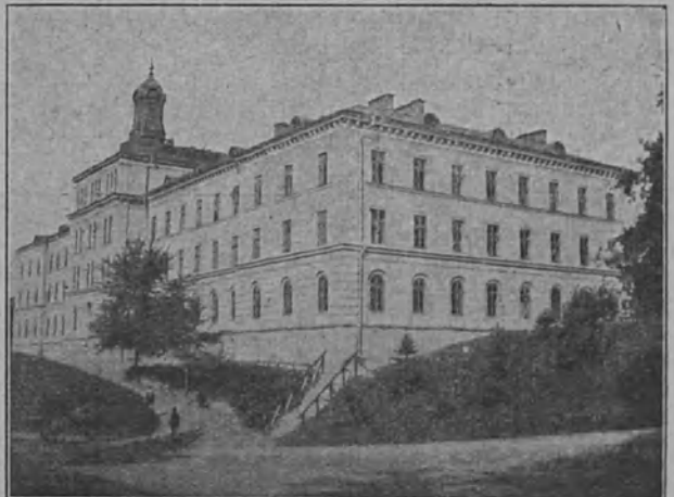
Manillan k.m. koulu Tukholmassa, jossa on myös k.m. kirkko.