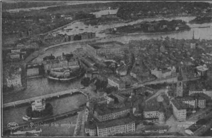
Tukholman kaupunki lentokoneesta katsottuna.