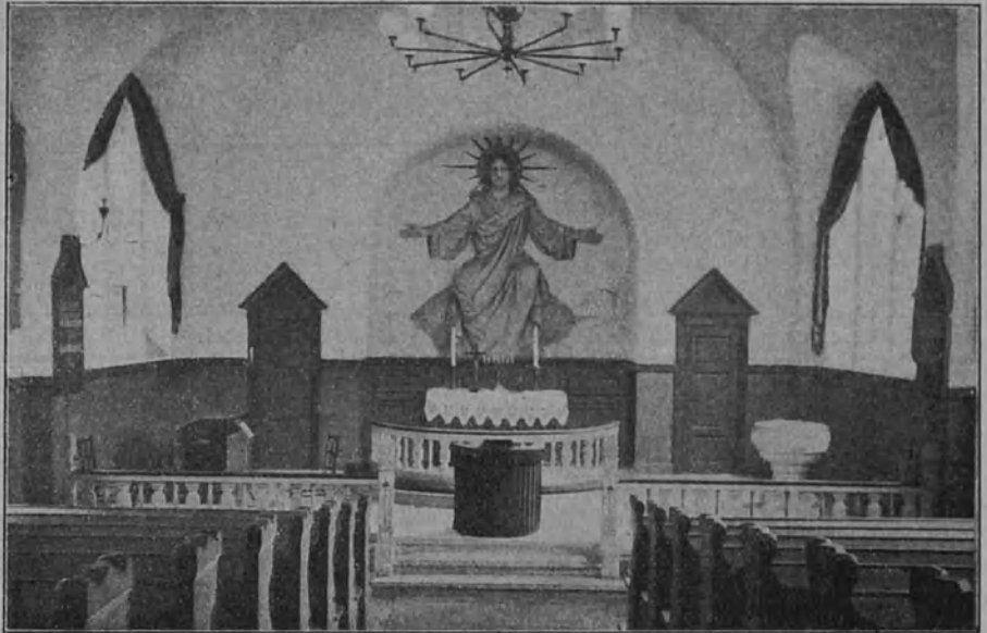
Köpenhaminan Kuuromykkäin kirkko sisäpuolelta.

Tällä tavalla, lyhyesti sanoen, on kuuromykkäin sielunhoito Tanskassa järjestetty. Ja se onkin riittävä. Köpenhaminan k.m. seurakunta onkin samassa asemassa kuin kuulevain seurakunnat. Heillä on oma pappi, oma kirkko ja omat jumalanpalveluksensa joka sunnuntai ympäri vuo-