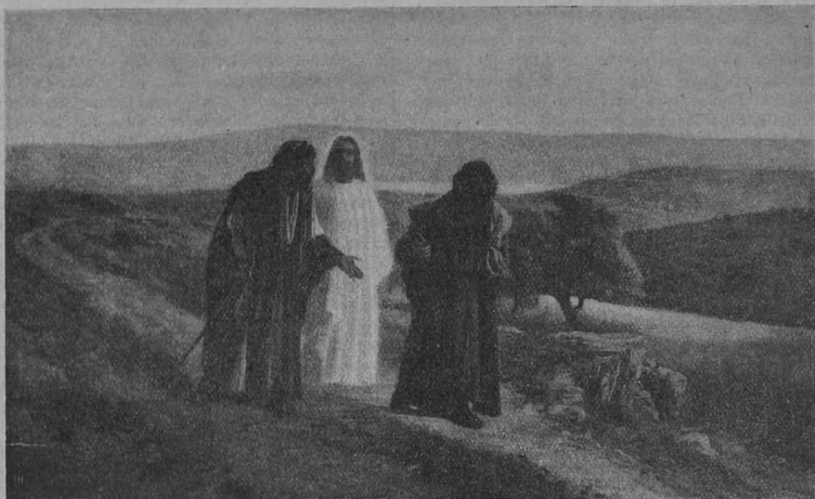
Jeesus ilmestyy kahdelle opetuslapselle tiellä Emaukseen.

Lukija, ota Uusi Testamenttisi ja lue Luukaan evankeliumia 24 luvusta v. 13—33.