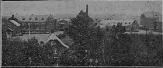
Vennersborgin kuurom. koulu.

hoitokodista pois lokakuun iltapäivän hämärään. Ajattelin noita onnettomia ihmisiä. Ajattelin koko maailman kurjuutta, mitä lukemattoman monet ihmiset kärsivät. Monet ihmiset hankkivat itse huonolla elämällä itselleen kärsimystä. Mutta monet perivät syntyessään vanhemmilta ja entisiltä sukupolvilta raskaita ruumiin ja sielun vaivoja ja vikoja. Ankara on perinnöllisyyden laki. Terveitten ihmisten pitäisi enemmän kiittää Jumalaa terveestä ruumiistaan ja sielustaan. Ja heidän pitäisi enemmän auttaa ja ilahduttaa niitä, jotka kärsimysten kuormaa kantavat.