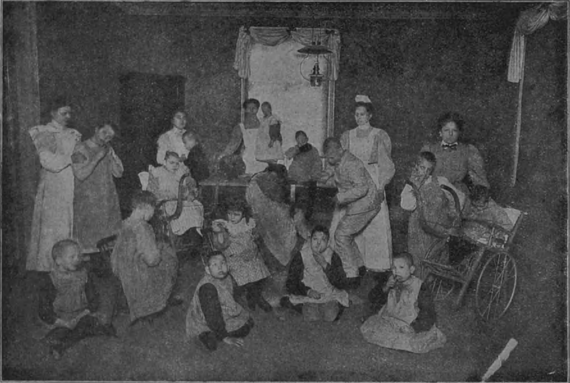
Sokeita k. m. ja tylsiä hoidokkaita Hoitokodissa.