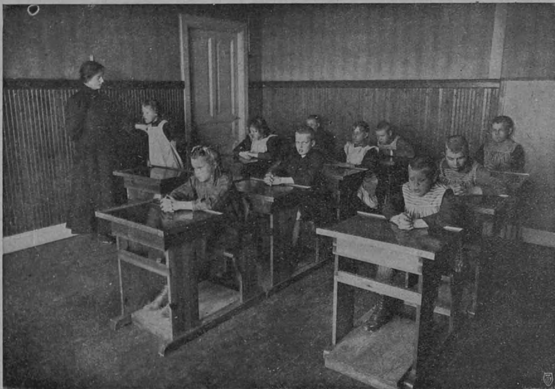
Sokeat kuuromykät ja heikkolahjaiset koulussa.

Vennersborgissa on toinenkin aistivalliskoulu, jossa opetetaan sokeita kuuromykkiä , ja sokeita heikkolahjaisia lapsia . Tämän 5-luokkaisen koulun yhteydessä on työkoti sellaisille koulun läpikäyneille oppilaille, joilla ei ole kotia tahi, jotka eivät omalla työllään muutoin voi