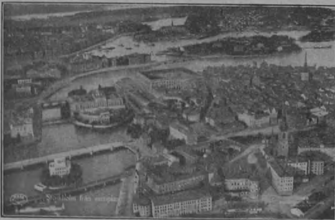
Tukholma lentokoneesta katsottuna. Keskellä kuninkaan linna. Taustassa Pohjoismainen museo, jonka ohi tie menee Manillaan.