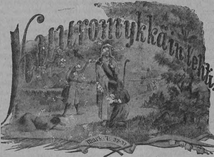
Kuuromykkäin lehti alussa, 25 vuotta sitten.

löihin, jotka ovat maassamme toimineet ja edelleen toimivat kuuromykkäin hyväksi. Luemme piispa Alo-pæus-vainajasta, johtaja Killisestä, tarkastaja Forsiuksesta, opettajatar Luomasta, miehistä ja naisista, jotka ovat elämänsä pyhitäneet kasvatukseen kuu-