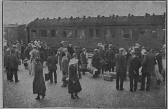
Juna saapuu Jyväskylään.