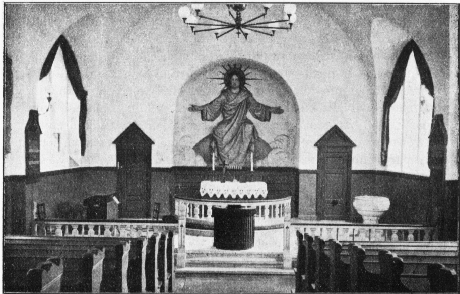
Köpenhaminan kuuromykkäin kirkko sisältä.

Tanskan pääkaupungissa, Köpenhaminassa, asuu paljon kuuromytkiä. Ennen ei heillä ollut omaa kuuromytkäin pappia, eikä jumalanpalveluksia heille pidetty. Kerran vuodessa matkustivat Tanskan vanhemmat kuuromytkät koulukaupunkeihinsa jumalanpalveluksiin silloin kun koulujen oppilaat päästettiin H. ehtoolliselle. Vuonna 1900 saivat Tanskan kuuromytkät ensimmäisen matkapapin. Hän asuu Köpenhaminassa ja matkustaa sieltä maaseuduille. Vuonna 1909 saivat kuuromytkät toisen matkapapin, joka asuu Fredericiassa. Alussa ei Köpenhaminan monilla kuuromytkillä ollut omaa huonetta jumalanpalveluksiaan varten. Mutta sitten