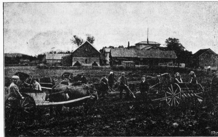
Koulun oppilaita työssä.