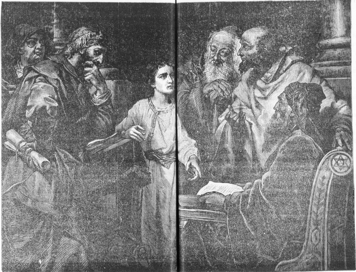
Jesus 12 vuoden ikänä temppelissä.